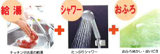
キッチンや洗面の給湯 たっぶりシャワー おふろ沸かし・追いだし