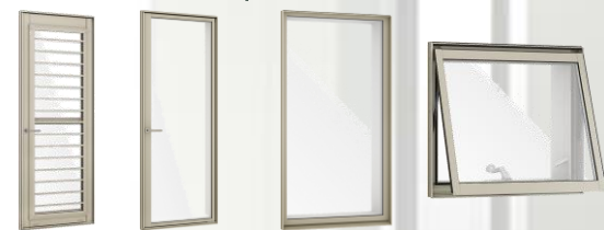
採風勝手口ドアFS テラスドア FIX窓