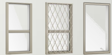
上げ下げ窓FS 面格子付き上げ下げ窓FS 縦すべり出し窓