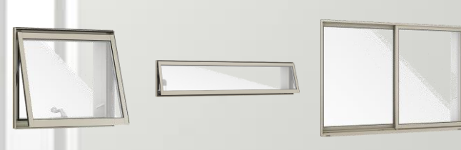
横すべり出し窓 高所用横すべり出し窓 装飾引違い窓