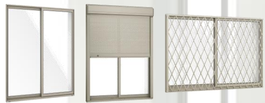
単体引違い窓 シャッター付き引違い窓 面格子付き引違い窓